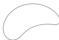
Tablet B 25 x 59 cm

Skriveplade i lamineret krydsfiner og overfladebehandlet med Micro effekt.